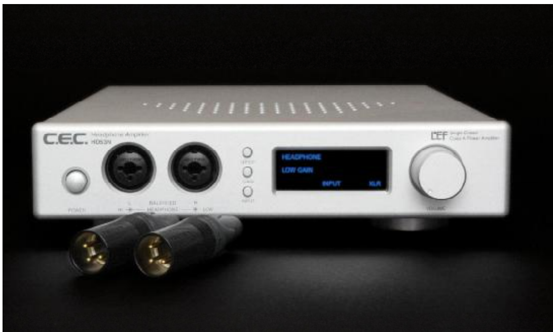
Klein, schick und top: CEC HD53N

Für viele Leser wird die symmetrische Kopfhöreransteuerung ein ganz neues Kapitel bedeuten. Aber keine Angst: es ist nur halb so kompliziert, wie es sich anhört. Was ist nun zu tun und auf was ist zu achten beim Konfektionieren? Am Klinkenstecker Ihres Kopfhörermodells müssen vier Adern anliegen. Plus und Minus der linken Spule sowie Plus und Minus der rechten Spule. Die beiden Minusadern müssen voneinander getrennt sein. Bei etlichen Kopfhörern wird leider vom Klinkenstecker aus eine gemeinsame Minusader für beide Spulen bis in die zumeist linke